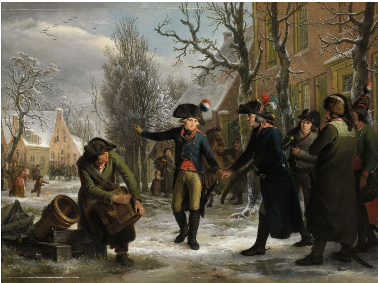
Adriaan Lelie, Generaal Daendels neemt afscheid van luitenant-kolonel Krayenhoff (Maarssen, 18 januari 1795)